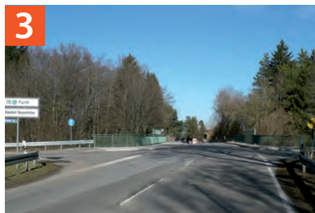
Sauerlacher Straße / Tölzer Straße