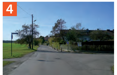
Laufzorer Straße / Wolfzorer Straße