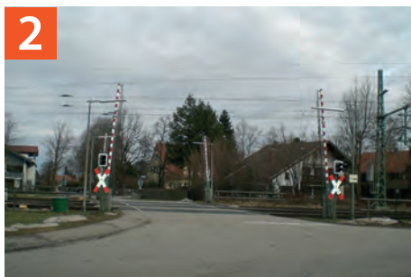
Jägerstraße - Bahnübergang