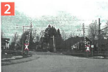
Jägerstraße - Bahnübergang