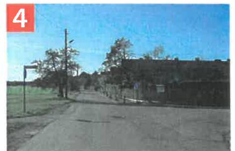
Laufzoner Straße / Wolfzoner Straße