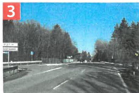
Sauerlacher Straße / Tölzer Straße