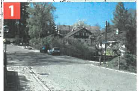
Bergstraße - Vorderes Gleissental